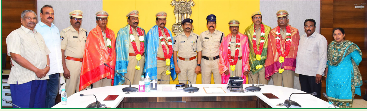
పదవీ విరమణ పొందిన వారి వివరాలు